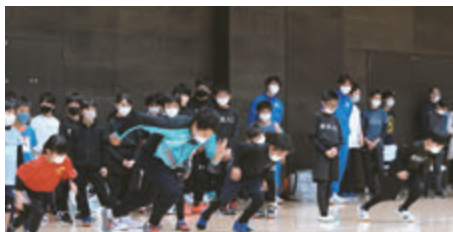
みはまスポーツフェスティバル