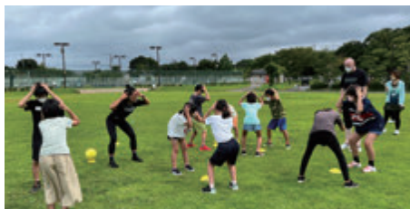
イングリッシュスポーツキャンプ