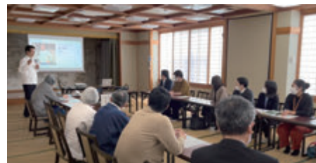
事業者向けサービス開発研修会