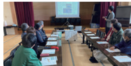
県外大学への合宿誘致活動