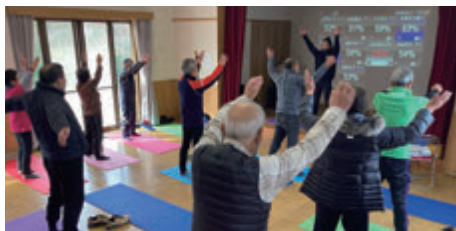
高齢者ヘルスケアプログラム